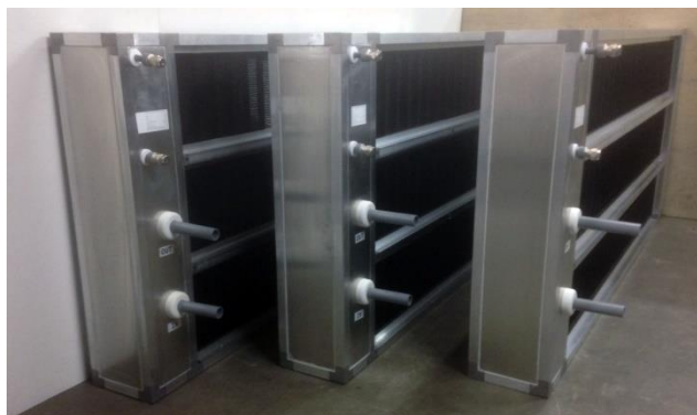
warmtewisselaar compleet 3H2D

De PolyCoil warmtewisselaar is opgebouwd uit speciale nylonbuisjes met dunne wanden en met een vergelijkbare warmte-/koudewisseling als van een conventioneel aluminium systeem. De warmtewisselaar behoudt zijn rendement echter over vele jaren, dit in tegenstelling tot de aluminium systemen die na enkele maanden door corrosie en aangroei al meer dan 10% van hun rendement verliezen. Door de anti-fouling en corrosiebestendigheid van de warmtewisselaar resulteert dit over tijd in een grote energierugwinning c.q. besparing.